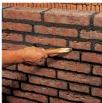
LHM be – бежево-белый

3. Кладка и расшивка швов производятся одновременно. Швы надавливая приглаживают. В зависимости от обработки получается гладкая или шероховатая поверхность швов.