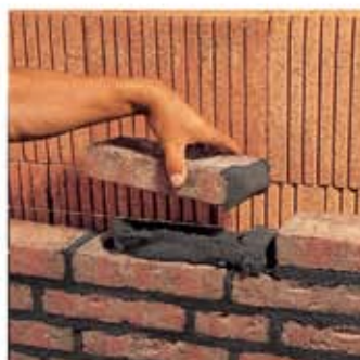
LHM hgr – светло-серый

1. Укладка камня на высокопластичном кладочном растворе LHM с полной заливкой швов, выпускаемом компанией quick-mix. Прочное сцепление раствора с кирпичом.