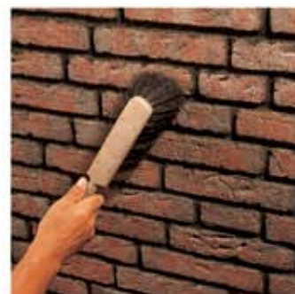
LHM hbr – светло-коричневый

4. Прочное, без трещин сцепление кирпича с основанием, однородная герметичная структура шва, водонепроницаемая, морозостойкая и погодостойчивая кладка.